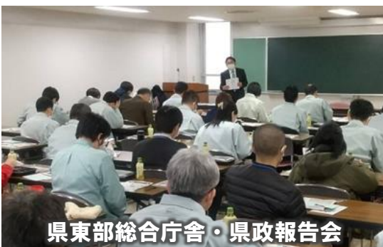
県東部総合庁舎・県政報告会

県の東部総合庁舎に勤める県職員に対して、リニア中央新幹線問題の視点、脱炭素社会に向けたライフスタイル転換の必要性、最低賃金アップ相当の賃金引上げの必要性、正規・非正規の格差是正など県職員が考えを変えていく必要性などを交えた県政報