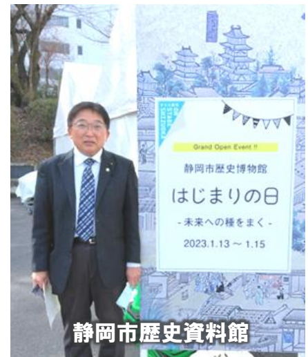
静岡市歴史資料館

静岡市歴史資料館の開所式に参加。内覧会は人数制限により、参加できず残念でした。大河ドラマ館もオープン。この2つの会館を無料で結ぶシャトルバスも運行されています。この一年全国から多くの方が訪れよう期待が膨らみます。