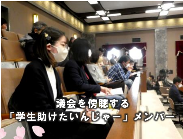
議会を傍聴する 「学生助けたいんじゃー」メンバー

新型コロナウイルスの影響で露呈した学生の貧困。県議会2月議会では、静岡県立大学内で食料支援を行っている「学生助けたいんじゃー」のメンバーが見守る中、「大学生の学びの保障」について質問しました。「学生助けたいんじゃー」は、学業に支障なく誰もがより良く学べる環境を作るために、キャンパスソーシャルワーカーを静岡県立大学に配置することを求める「署名活動」を行っています。ご協力をお願い致します。詳細は▶ 検索 学生助けたいんじゃー