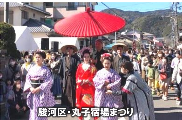
駿河区・丸子宿場まつり