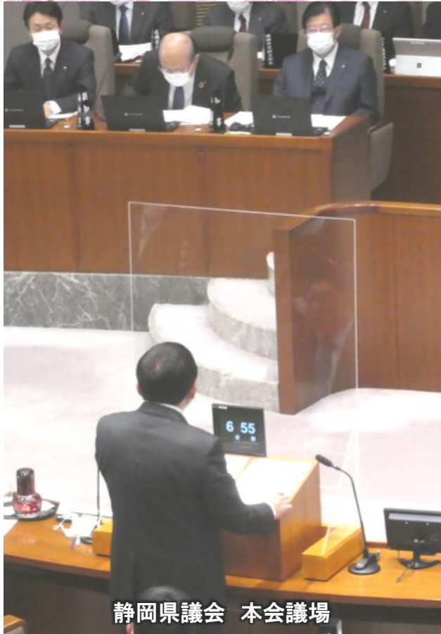
静岡県議会 本会議場

1期目最後の県議会。本会議の一般質問と厚生委員会での質疑を行いました。「本当に困っている人の声を政治の場に届けたい」、「勤労者・労働者にもっとやさしい社会をつくりたい」、「子どもたちが将来にわたって平和で安全な社会をつくりたい」との思いをもち県議会議員に当選して3年11か月。前回駿河区で獲得した12,804票の重みを忘れず、活動が続いています。自治会活動、PTA活動が私の活動の原点です。地域に貢献する、役立つために引き続き取り組んでいきます。