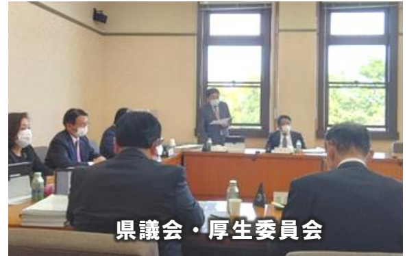
県議会・厚生委員会

問題提起はできましたが、県からの説明と対応の答弁は納得いくものではありませんでした。実現するまで粘り強く発言し続けます。